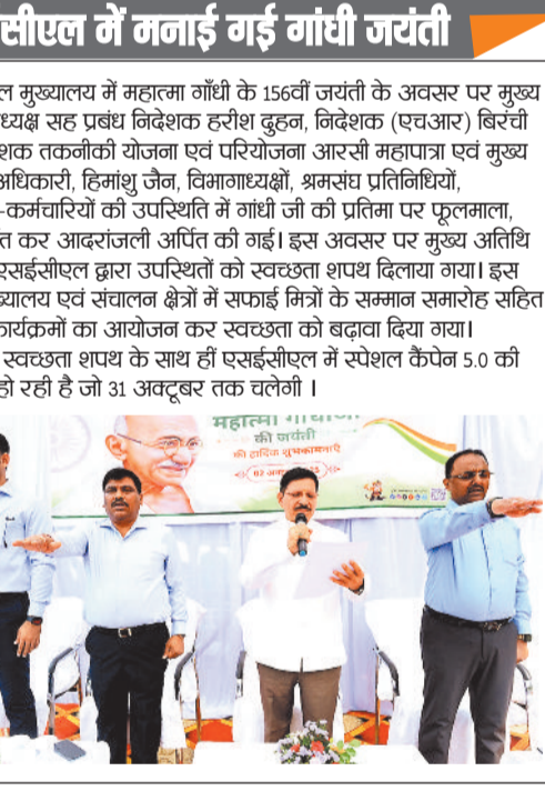
कार्यक्रम में उपस्थित स्थानीय जनप्रतिनिधि।