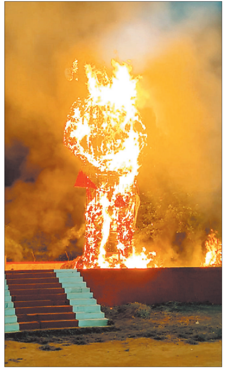
रेलवे नार्थ मैदान में रावण दहन किया गया।