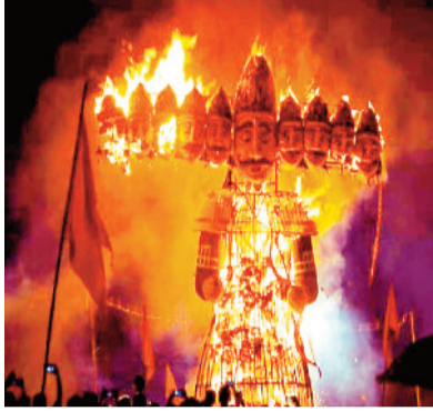
धुं धुंकर जलता रावण।

जिले सहित उपनगरीय क्षेत्रों में आयोजित रावण दहन के लिए दोपहर से ही ग्राउंडों में लोगों की भारी भीड़ उमड़ गई थी। लगातार हो रही बारिश की वजह से समितियों को खासी परेशानियों का सामना करना पड़ा। गुरुवार की दोपहर मौसम ने करवट बदली और फिर से