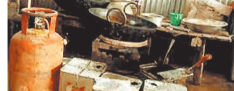
द्वारा नियमों को ताक में रखकर कर्मशिवल के बजाय घरेलू सिलेंडरों का उपयोग दुकान संचालन में कर दे रहे हैं। जिसके

जांजगीर-चांपा। जिले के होटल ढाबो एवं मिष्ठान भंडारों में व्यापारी कर्मशिवल की जगह घरेलू सिलेंडरों का उपयोग करके शासन को हर साल करोड़ों रूपए का चुना लगा रहे हैं। होटल, ढाबा, मिष्ठान भंडार सहित अन्य संस्थानों में नियमों के तहत कर्मशिवल गैस सिलेंडर का उपयोग सामान बनाने में किया जाना रहता है, लेकिन जांजगीर-चांपा जिले के पांच विकासखंड अंतर्गत शहरी क्षेत्रों में इसका उल्लंघन हो रहा है। कामशिवल सिलेंडर की कीमत भी घरेलू सिलेंडर से काफी अधिक होती है, लेकिन होटल के संचालकों के