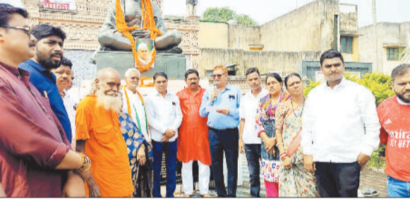
कार्यक्रम में उपस्थित स्थानीय जनप्रतिनिधि।