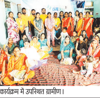
कार्यक्रम में उपस्थित ग्रामीण।