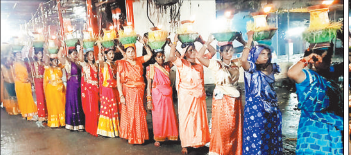
जवारा विसर्जन करते श्रद्धालुगण।