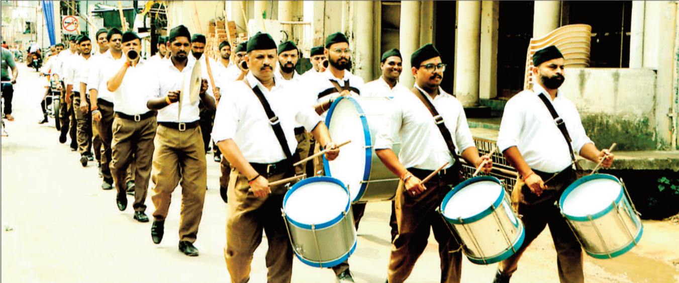
विजयादशमी के अवसर पर गुरुवार को आरएसएस के पथ संचलन में शामिल हुए स्वयंसेवक।