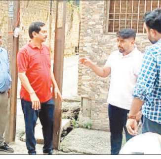
अधिकारियों को निर्देश देते निगम आयुक्त।

हरिभूमि न्यूज ►► कोरबा आयुक्त आशुतोष पांडेय ने निगम के अधिकारियों को निर्देश देते हुए कहा है कि डोर टू डोर अपशिष्ट संग्रहण को