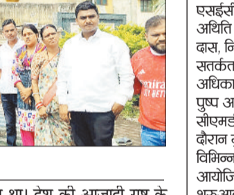
कार्यक्रम में उपस्थित स्थानीय जनप्रतिनिधि।