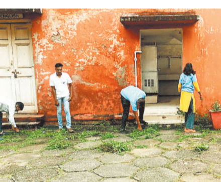
कार्यक्रम में उपस्थित स्थानीय जनप्रतिनिधि।