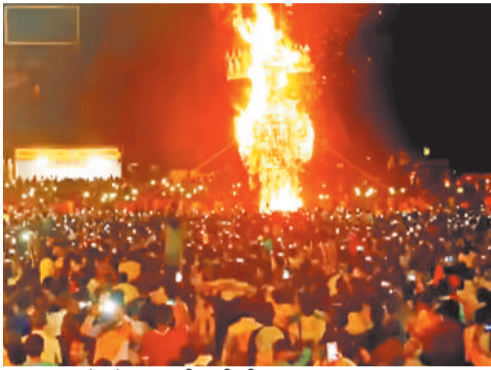
रावण दहन के दौरान उमड़ी भारी भीड़।